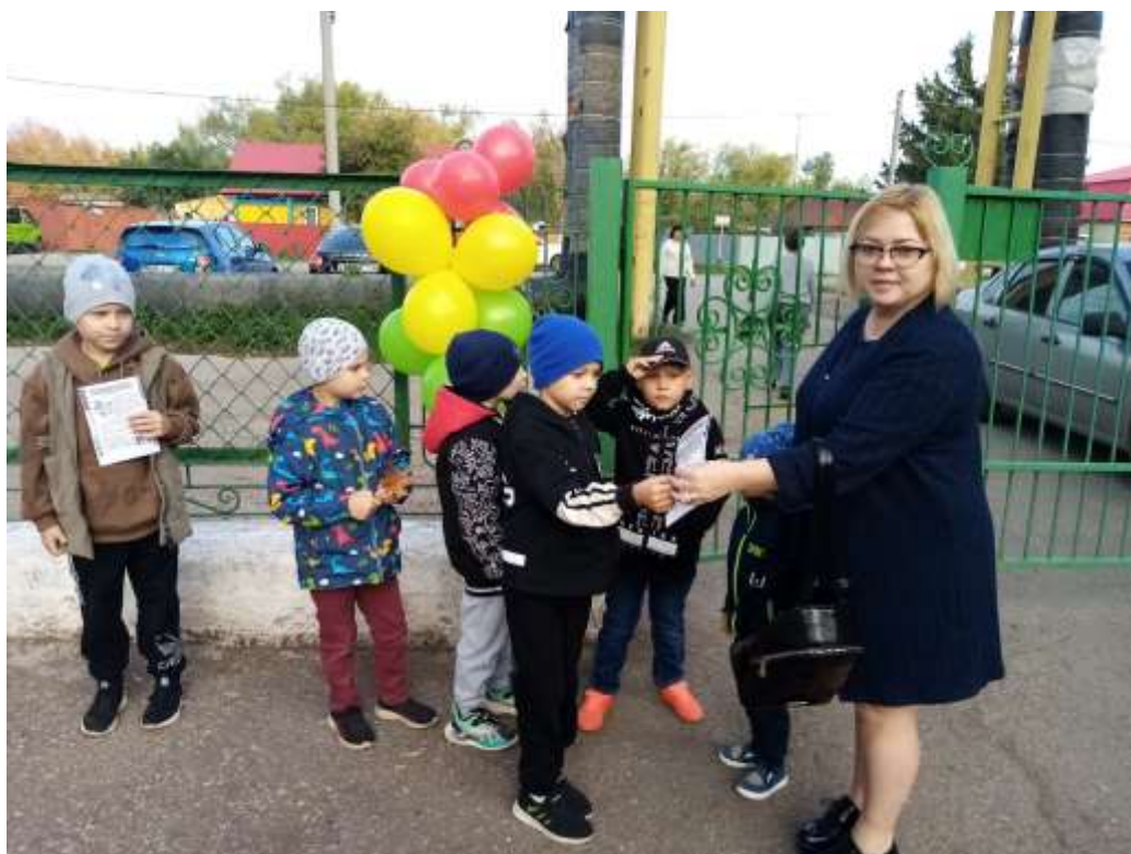
Экскурсия к пешеходному переходу